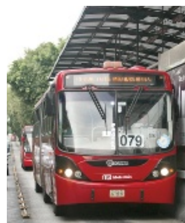
► El transporte, amigable con el ambiente, traslada a miles de capitalinos.

La Línea 1 corre de Insurgentes Norte a la salida a Cuernavaca y la 2 de Tacubaya a Tepalcatates.