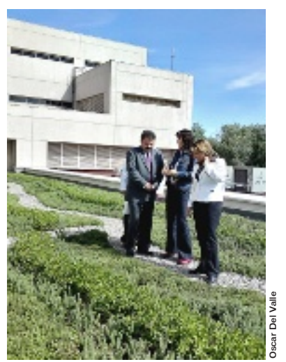
► La azotea del Hospital Belisario Domínguez ya es verde.

"En los últimos dos años el Gobierno del Distrito Federal ha creado más de ocho mil metros cuadrados de naturaleza de inmuebles propiedad del Gobierno como una alternativa viable para la recuperación y la compensación de las áreas verdes en el entorno urbano", explicó la Secretaria.