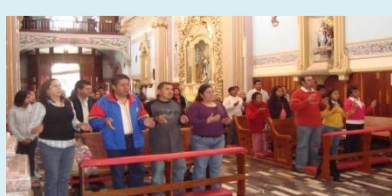
Participación de los Sordos en la Eucaristía

Esperemos ver buenos frutos de esta reunión en la que el obispo compartió su tiempo toda la mañana con la comunidad de sordos de Tlaxcala.