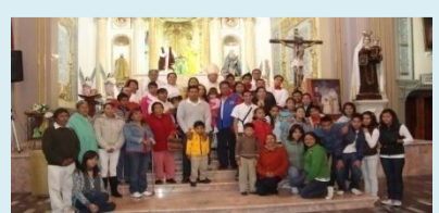
Asistentes a la I Reunión Diocesana de Pastoral de Sordos de Tlaxcala

"No solo de pan vivirá el hombre, sino de toda palabra que sale de los labios de Dios." Mateo 7: 1 - 2